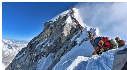
Les alpinistes faisant la queue sur l'Everest !!