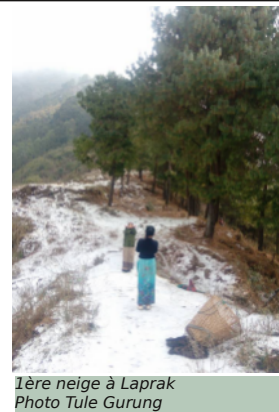
1ère neige à Laprak